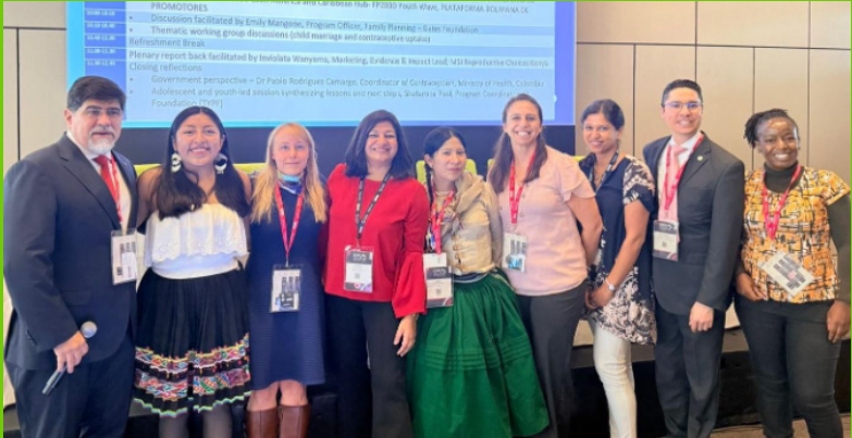
Orateurs et experts lors de la pré-conférence OMS/CIPF pour la promotion de la santé sexuelle et reproductive des adolescents (SSRA)