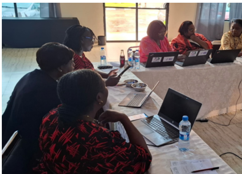
Participants testant l'Acceptation par les utilisateurs de Smartcare Pro en Zambie, 24-28 février 2025

L'OMS et le Ministère de la Santé de la Zambie ont organisé un atelier de test d'acceptation utilisateur pour examiner le prototype de module amélioré pour Smartcare Pro (système numérique national). Des experts en santé numérique, en SSR, en systèmes d'information sur la santé, en suivi et évaluation et en prestation de services de PF ont validé la fonctionnalité du module et proposé des améliorations. Le déploiement de DAK commencera dans cinq sites de validation avant d'être étendu à plus de 700 établissements de soins de santé primaires à l'échelle nationale.