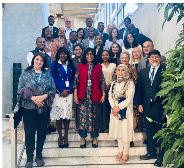
Les participants à la Réunion d'examen et de planification de l'Accélérateur Plus de la planification familiale de l'OMS, le 15 septembre 2025, Siège de l'OMS, Genève

Les représentants des pays évoquent ensemble les obstacles auxquels ils sont confrontés et les solutions trouvées en vue de mettre à l'échelle les conclusions fondées sur des données probantes, conformément au protocole d'analyse des goulets d'étranglement (BNA). 16 septembre 2025.