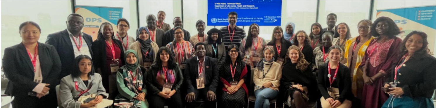
Des experts et des scientifiques en début de carrière à la fin de quatre jours d'atelier d'écriture scientifique, 3-6 novembre, CIPF 2025

L'OMS et la Johns Hopkins Bloomberg School of Public Health ont organisé un atelier de quatre jours d'écriture scientifique, de mentorat et d'accompagnement de carrière. Ce dernier a rassemblé plus de 100 scientifiques en début de carrière dont les projets de recherche ont été acceptés par le CIPF, ce qui leur a donné l'opportunité de bénéficier de conseils pratiques et leur a servi à renforcer leurs compétences en rédaction scientifique. Ces séances comportaient des conférences d'experts et des groupes de travail interactifs visant à développer des manuscrits de haute qualité. Les participants vont maintenant entamer un programme de mentorat de six mois sous la houlette de l'OMS et de la Fondation de Genève pour l'Education et la Formation médicale . durant lequel chaque participant sera associé à un mentor qui le/la guidera dans la rédaction et la publication de son manuscrit.