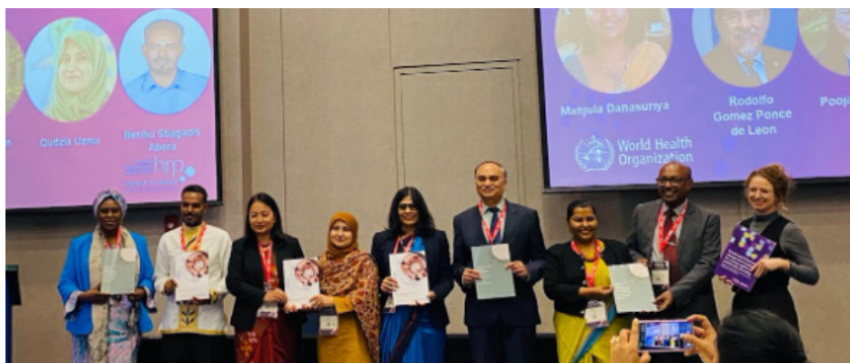
Lignes directrices actualisées de l'OMS en matière de planification familiale : 6 e édition des Critères d'éligibilité médicale CEM et 4 e édition des Recommandations de pratiques sélectionnées RPS

L'OMS soutient les ministères de la Santé et leurs partenaires en vue d'accélérer la qualité, les services de PF fondés sur les droits au sein du cadre des Objectifs de Développement Durable (ODD), de la Couverture Sanitaire Universelle (CSU) et du 14e Programme Général de Travail (PGT 14) de l'OMS. La Pré-conférence de l'OMS sur l'assistance technique aux pays , qui a eu lieu le 3 novembre, a mis l'accent sur les principaux développements en matière de planification familiale. La pré-conférence a présenté le Projet Accélérateur Plus de la planification familiale (PF), a lancé trois nouveaux guides de mise à niveau de la PF, et a présenté un groupe d'experts sur les goulets d'étranglement (BNA) qui a fait part des expériences au Népal, au Pakistan, en Éthiopie ainsi que dans la région de l'Amérique latine et des Caraïbes. Y ont été également présentés : la ligne directrice mise à jour de l'OMS sur la prévention de la grossesse précoce et sur les mauvais résultats reproductifs parmi les adolescents dans les pays à revenu faible ou intermédiaire, ainsi que de nouvelles mises à jour de recherches.