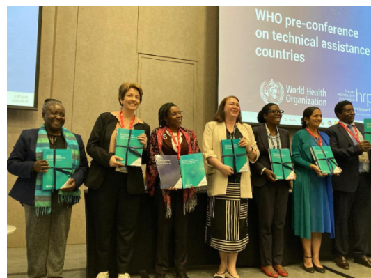
Lancement des CEM et des RPS à la pré-conférence de l'OMS sur l'assistance technique aux pays