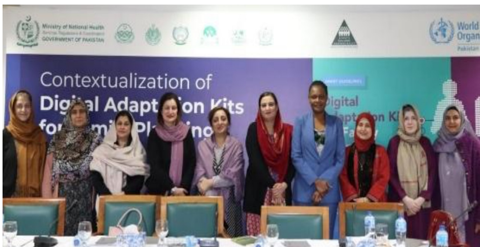
Des représentants du Ministère de la Santé, de l'OMS et des organisations partenaires se sont réunis pour adapter le PF DAK à Islamabad au Pakistan, le 31 janvier 2025

Le ministère des Services nationaux de santé, de la réglementation et de la coordination, en collaboration avec l'OMS, a convoqué la réunion d'un comité central pour examiner et adapter le DAK de la planification familiale (PF) de l'OMS. Les responsables gouvernementaux, les experts techniques et les partenaires de développement ont identifié les lacunes contextuelles et proposé des adaptations à la boîte à outils. La réunion s'est terminée par un engagement à piloter le montage FP adapté, à renforcer la coordination au niveau fédéral-provincial et à suivre les progrès grâce à un tableau de bord numérique national.