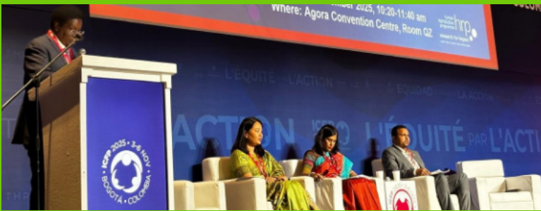
Des intervenants de l'OMS Népal, du ministère éthiopien de la Santé, de la Coalition pour l'approvisionnement en produits de santé reproductive et du siège de l'OMS ont participé à la discussion sur la mise à l'échelle des services de planification familiale post-grossesse.

Un groupe d'experts pré-formé par l'OMS sur la mise à l'échelle de pratiques fondées sur des données probantes en planification familiale post-grossesse s'est tenu le 5 novembre 2025. Des équipes venues du Népal, de l'Éthiopie et du Pérou ont partagé leurs expériences d'utilisation de l'analyse des goulets d'étranglement (BNA) pour identifier des obstacles dans les systèmes de santé, établi un consensus national et conçu des stratégies en vue d'améliorer la mise à l'échelle des services de planification familiale post-grossesse.