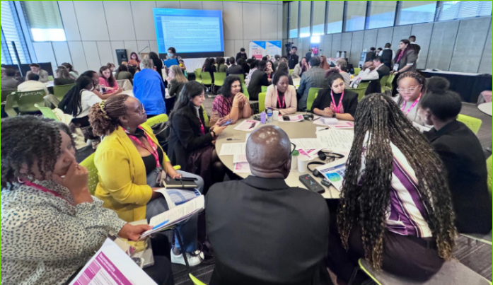
Les participants se sont engagés dans des discussions thématiques de groupe pour passer des paroles à l'action.

Un atelier de pré-conférence le 3 novembre s'est penché sur la prévention de la grossesse précoce et sur les mauvais résultats reproductifs parmi les adolescents. Cette réunion a rassemblé de jeunes porte-paroles, des représentants des pouvoirs publics, des agents de mises œuvre, des chercheurs, des bailleurs de fonds et des membres de la société civile. Un discours inaugural a été prononcé par Aparajita Ramakrishnan, Directrice de la Planification Familiale à la Fondation Gates. Un groupe d'experts a fait une communication sur la prévention des mariages d'enfants et l'amélioration de l'accès des adolescents à la contraception. Les participants ont pris part à un groupe de travail en vue de développer des stratégies réalisables spécifiques à un pays pour l'adaptation et l'adoption de lignes directrices.