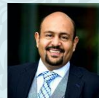
Soudan - Khalifa Elmusharaf